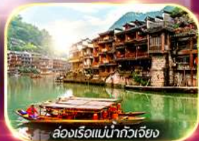
ล่องเรือแม่น้ำกวางเจียง