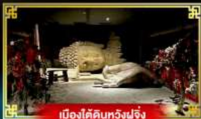
เมืองใต้ดินหวังฟูเจิง