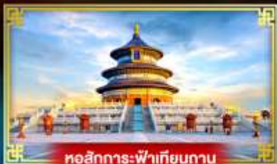
หอสิกการะฟ้าเทียนถาน