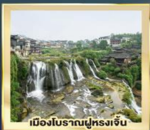
เมืองโบราณฝูหลงเจิน