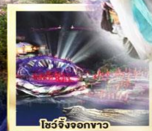
โชว์จิ้งจอกขาว