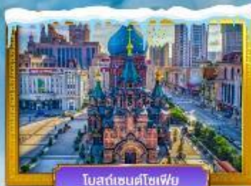
โบสถ์เซนต์โจเซฟ