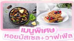
เมนูพิเศษ หอยมัสเซล+วาฟเฟิล