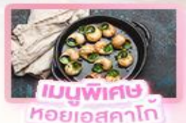
เมนูพิเศษ หอยออสตาโก้

เยอรมัน เนเธอร์แลนด์ เบลเยียม ฝรั่งเศส Keukenhof