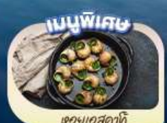
ของแถมพิเศษ

เดินทาง 9 - 16 พ.ค.68 19 - 26 พ.ค.68 26 พ.ค. - 2 มิ.ย.68