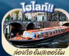
ล่องเรือ อัมสเตอร์ดัม

สะพานไอเอ็นชอลเลิร์น ล่องเรือชมหมู่บ้านกีโรน กังหันลมชาลส์คันส์ คลองอัมสเตอร์ดัม บรัสเซลส์ อะโตเมียม จัตุรัสบรูจส์ หอไอเฟล จัตุรัสคองคอร์ด พิพิธภัณฑ์ลูฟร์ ล่องเรือแม่น้ำแซน ซุปปิ้งแบบจิวอี้ที่ห้างซินน่า