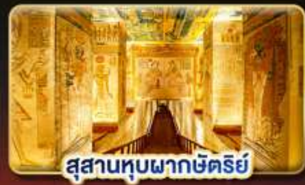
สุสานหุบผากษัตริย์