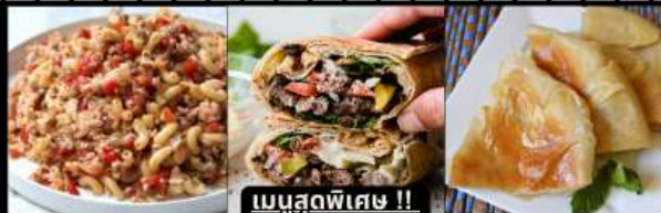
เมนูสุดพิเศษ !! KOSHARI (ข้าวคลุกถั่ว) / SHAWERMA (เนื้อห่อแป้ง) / FITEER BALADI (พืชข้าอียิปต์)