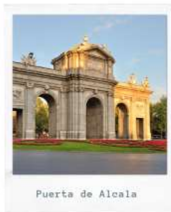
Puerta de Alcala

แล้วไปชม ปลaza เดอ เอสปันญา (Plaza de Espana) ชมอนุสาวรีย์เซอร์แวนเตส กวีเอกชาวสเปน ที่ตั้งอยู่เหนืออนุสาวรีย์ดอนกิโฆเต้ในสวนสาธารณะ นำเที่ยวชมสถานที่สำคัญของกรุงแมดริด น้ำพุไซเบเลส ที่สร้างอุทิศให้แก่เทพธิดาไซเบ ลีน อาคารสวยงามใกล้ๆ กันคือ ที่ทำการไปรษณีย์, ประตูลิชยาคาล่า, ปลaza มา ยอร์ จัตุรัสสำคัญของกรุงมาดริด, ตลาดซันมีเกล ปัจจุบันย่านนี้เป็นถนนคนเดิน เต็มไปด้วยร้านค้าแฟชั่นน่ารัก, ปูเอต้า เดล ซอล หรือประตูพระอาทิตย์ จัตุรัสใจกลางเมือง จุดนับ กิโลเมตรแรกของสเปน และยังเป็นจุดตัดของถนนสายสำคัญของเมืองที่หนาแน่นด้วยร้านค้ามากมาย และห้างสรรพสินค้าขนาดใหญ่ El Corte Ingles