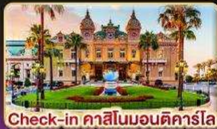
Check-in คาสสิโนมอนติคาร์โล