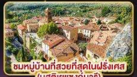
ชมหมู่บ้านที่สวยงามที่สุดในฝรั่งเศส (มูสติเยแซงก์มารี)