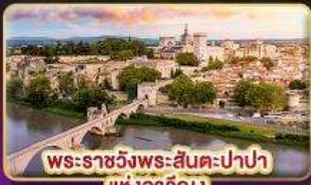
พระราชวังพระสันตะปาปา แห่งอวีญง