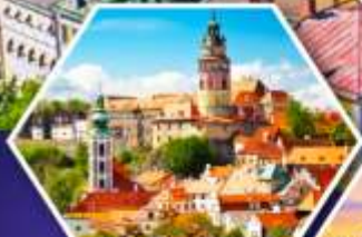
เช็กที่ครุมลอฟ

ฟรี ประกัน สุขภาพ และอุบัติเหตุ 3,000,000 GTP Plus (Gold Plan)