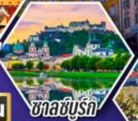
ซาลซ์บูร์ก