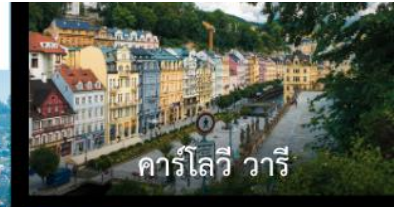
คาร์โลวี วารี