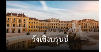
วังเซิงบรุนน์