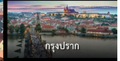
กรุงปราก