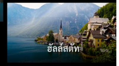
ซัลทซ์บวร์ค