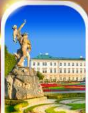
MIRABELL PALACE AUSTRIA