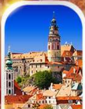
CESKY KRUMLOV CZECH