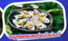
เมนูหอยแมลงภู่อบไวน์ขาว