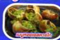
เมนูหอยแมลงภู่อบไวน์ขาว

ทานอาหาร ณภัตตาคารบนหอไอเฟล พร้อมชมวิวแสนโรแมนติก เมนูหอยแมลงภู่อบไวน์ขาว