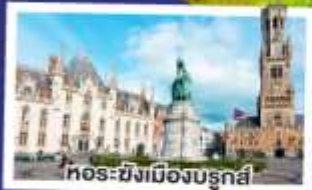
หอระฆังเมืองบรูจส์