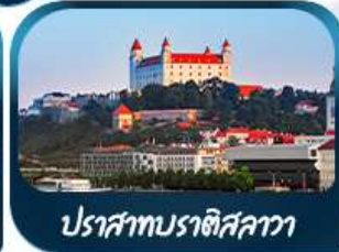
ปราสาทบราติสลาวา