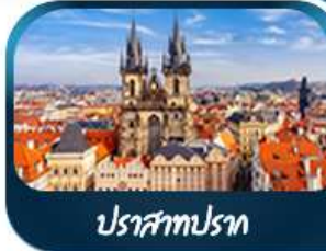
ปราสาทปราก

ชมความอลังการ ปราสาทนอยชวานสไตน์ เยือนเมืองมิวนิก จักรีสมาเรียนพลัทซ์ สัมผัสเมืองมรดกโลก เซสท์ ครุมลอฟ ถ่ายภาพไฮไลท์! ปราสาทครุมลอฟ เยือนชมปราสาทปราก ถนนทองคำ หอนาฬิกาอาราคาสคร์ เช็กจินสถานี่ชื่อดัง! ปราสาทบราติสลาวา ส่องเรือชมความงามแม่น้ำดานูบ แม่น้ำที่ยาวที่สุดในยุโรป ชมความน่าหลงใหลของ ปราสาทบูดาเปสต์ เที่ยวชมหมู่บ้านริทเก-เลซาบอัลสส์ดัทท์ พระราชวังเซ็นบูร์นน์ สวนมิราเบล