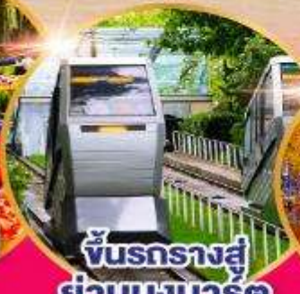
ชั้นรถรางสู่ ย่านมงมาร์ต