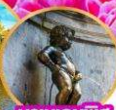
มานเคนพิส