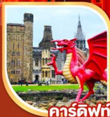
คาร์ดิฟฟ์