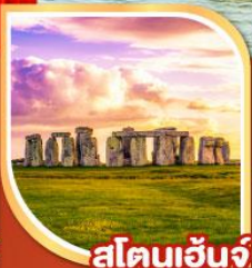
สโตนเฮ็นจ์