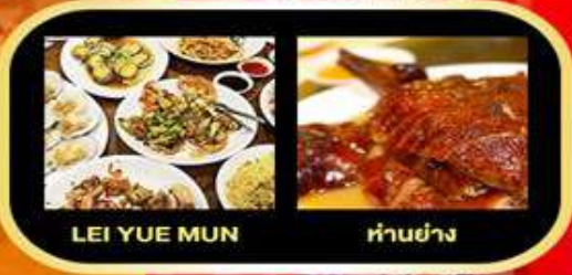
LEI YUE MUN