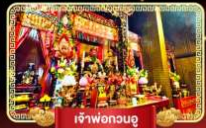
เจ้าพ่อกวนอู