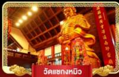
วัดเขangkหมิว