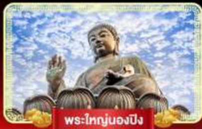
พระใหญ่นองปิง

ฟรีเปิดทองพระคลังเจ้าแม่กวนอิม บินลัดฟ้าไปมูสู่เกาะฮ่องกง