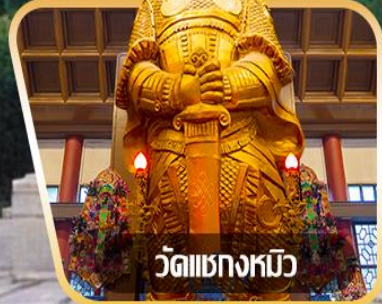
วัดเขangkงมัว