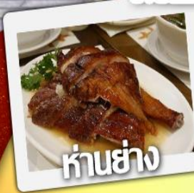
ก้านย่าง