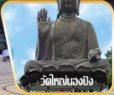
วัดใหญ่หนองปิง