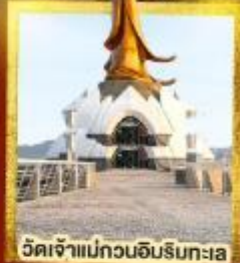
วัดเจ้าแม่กวนอิมบริบทละ