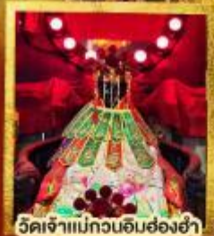
วัดเจ้าแม่กวนอิมสองฮา