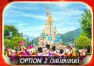
OPTION 2 ดิสนีย์แลนด์

เต็มอิ่ม ทั้งไหว้พระ-ขอพร การเงิน การงานความรักและซ่อมปัง