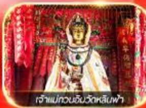
เจ้าแม่กวนอิมวัดหลินฟ้า