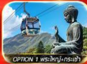
OPTION 1 ปร-ใหญ่+กร-เช้า