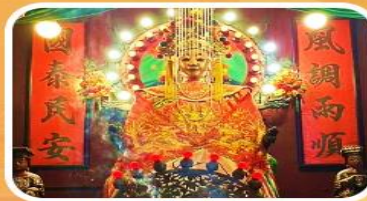
วัดเจ้าแม่กวนอิมเทียนหัว