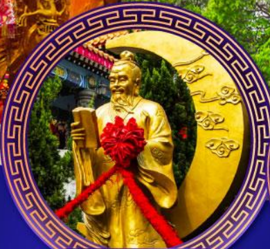
วัดหวังต้าเซียน

24-27 ต.ค. 67 08-11 พ.ย. 67 13-16 ก.พ. 68