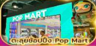
ตะลุยช้อปปิ้ง Pop Mart