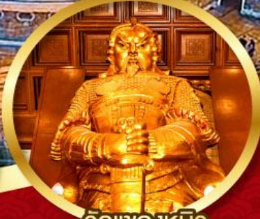
วัดแกลงหีบ ขอพรโชคกลาง การเงิน และ ธุรกิจ