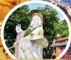
เจ้าแม่กวนอิม รัชกาลที่ ๗