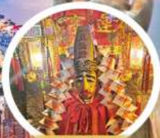
วัดลิมฟ้า