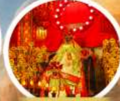
เจ้าแม่กวนอิมฮองซา