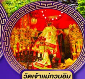
วัดเจ้าแม่กวนอิม ฮ่องฮ่า