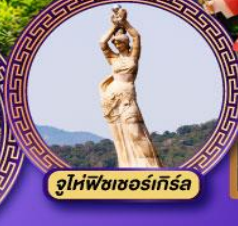
จูไห่พิชเชอร์เกิร์ล