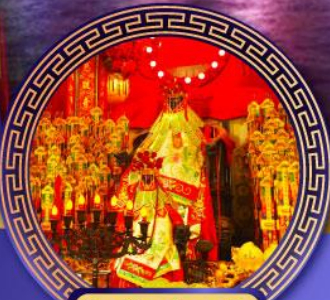
วัดเจ้าแม่กวนอิม ฮองฮา