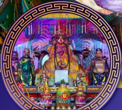
ศาลเจ้าหังเจีย