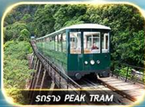
สร้าง PEAK TRAM