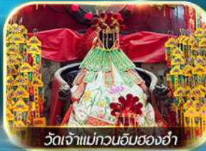
วัดเจ้าแม่กวนอิมสองห้า