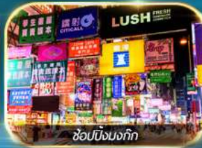
ช้อปปิ้งมอลล์

เต็มอิ่มทั้งบุญ และ ช้อปปิ้งแบบจัดเต็ม จิมซาจุ่ย มงก๊ก