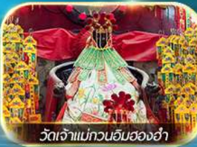
วัดเจ้าแม่กวนอิมของฮ่า