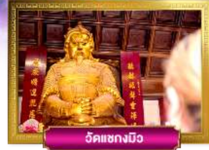
วัดแชกงมิ่ง

เดินทางโดย: สายการบินไทยแอร์เวย์ อาหารบนเครื่อง : ไป-กลับ อาหาร : 6 มื้อ โรงแรม : 4 ดาว