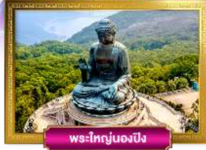
พระใหญ่บนองปิง