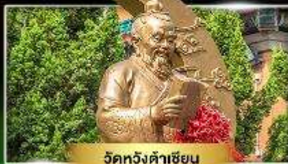
วัดพนมฉียน