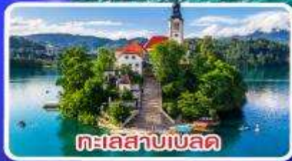
ทะเลสาบเบลด์

ไข่มุกแห่งอาเดรียติก พร้อมขึ้นกระเช้า SRD