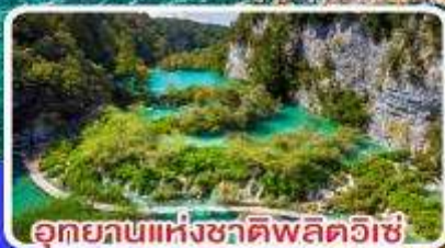
อุทยานแห่งชาติพลิตวิเช่