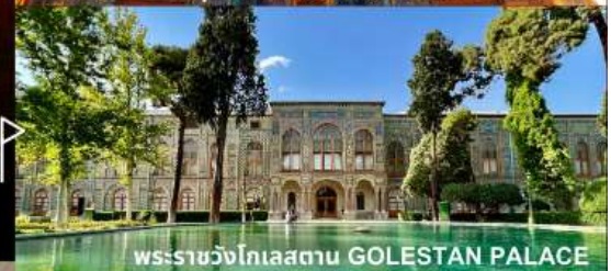
พระราชวังโกเลสถาน GOLESTAN PALACE