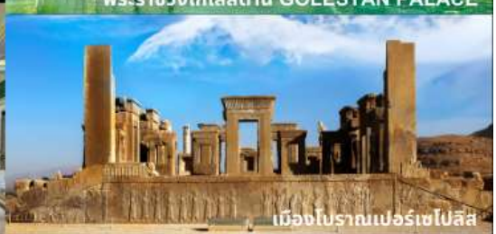
เมืองโบราณเปอร์เซโปลิส