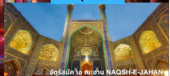
จัตุรัสบิก ไอ ฉะฮาน NAQSH-E-JAHAN