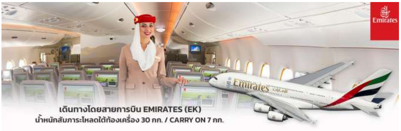
เดินทางโดยสายการบิน EMIRATES (EK) น้ำหนักสัมภาระโหลดใต้ท้องเครื่อง 30 กก. / CARRY ON 7 กก.