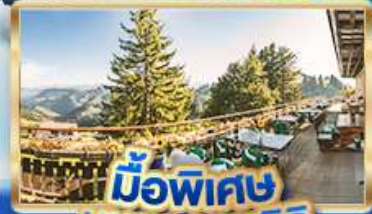
มือพิเศษ บียอดเวริท