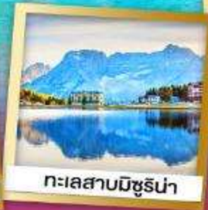
ทะเลสาบมิชูรีน่า