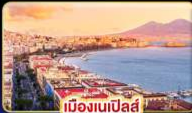
เมืองเนเปิลส์