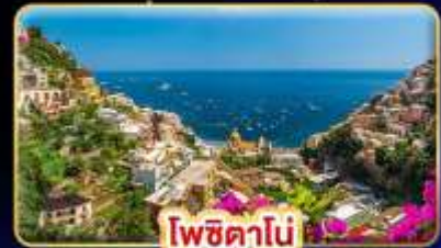
โพซิทานิ