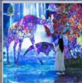
“TEAM LAB FOREST”