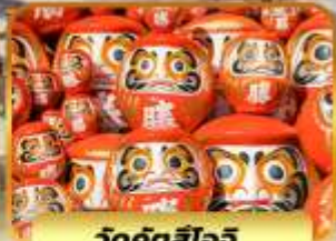
วัดคังดสิโอะจิ