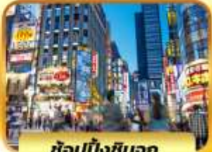
ช้อปบั้งชินจูกุ