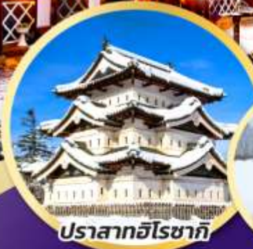
ปราสาทฮิโรซากิ