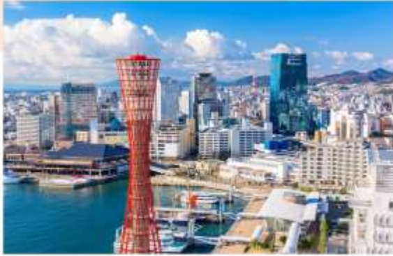
รับประทานอาหารเช้าในโรงแรม