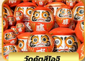
วัดคิตสึโอจิ