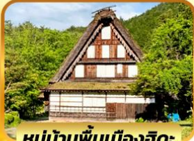
หมู่บ้านพื้นเมืองฮิดะ