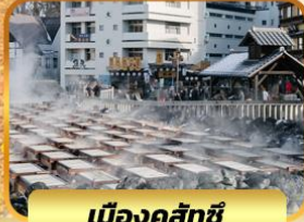
เมืองคุสัทซึ