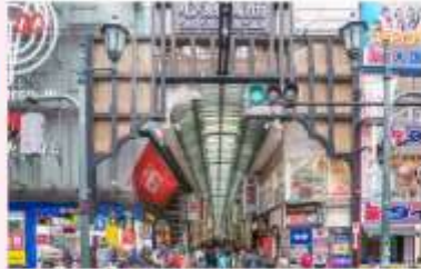
SHOP AT SHINSAIBASHI