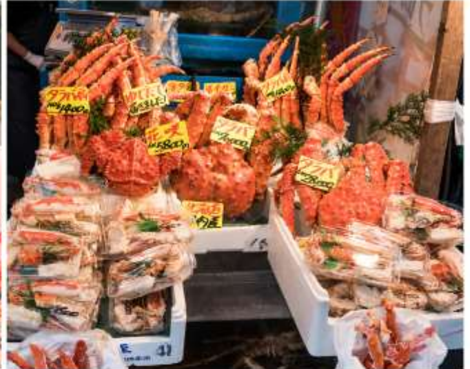
ตลาดปลาซึกิจิ

เป็นที่ที่มีชื่อเสียงมากที่สุดของญี่ปุ่น อีกทั้งยังเป็นที่ยุ้จักกันดีว่าเป็นหนึ่งในตลาดปลาที่ใหญ่ที่สุดในโลกจากการที่มีการซื้อขายสินค้าทะเลขกว่า 2,000 ตันต่อวัน ภายในตลาดแบ่งออกเป็น 2 ส่วนใหญ่ๆ คือส่วนภายนอกซึ่งมีร้านค้าปลีกและร้านอาหารตั้งเรียงรายเป็นจำนวนมาก และส่วนภายในซึ่งเป็นบริเวณที่ร้านค้าส่งใช้เจรจาธุรกิจและเป็นจุดที่มีการประมูลปลาทูน่าที่มีชื่อเสียง