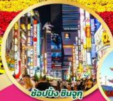
ช้อปปิ้ง ชิinjuku