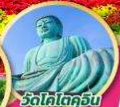
วัดโคโตะคุจิน