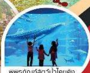
พิพิธภัณฑ์สัตว์น้ำโคยูกัง