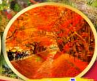
อุโมงค์ใบเมเปิ้ล โมมิจิ โคโร