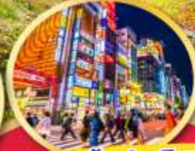
ช้อปปิ้ง ย่านชินจูกุ

พักออนเซ็น 1 คืน , พักโตเกียว 2 คืน บินเข้านาโกย่า-ออกโตเกียว